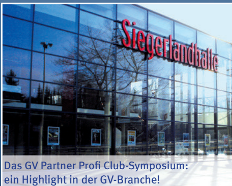
Das GV Partner Profi Club-Symposium: ein Highlight in der GV-Branche!