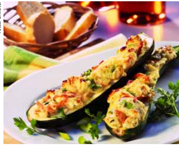
Gemüse essen heißt ohne Reue genießen. Mit der Kreta-Küche kann man sich satt essen, ohne Übergewicht befürchten zu müssen.

tionen eine zentrale Rolle spielen. Tomaten haben auch einen vorbeugenden Effekt gegen Herz-Kreislauf-Erkrankungen. In einer großen Fall-Kontrollstudie der Women's Health